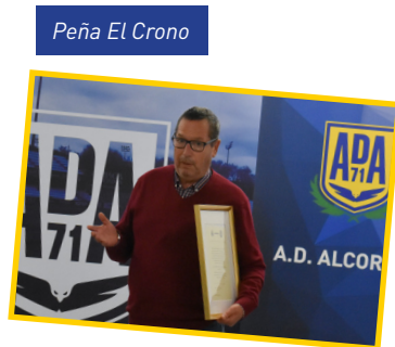
Peña El Crono