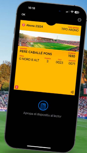
CON EL ABONO NFC

Todos los abonados del Girona FC tendrán esta temporada tres maneras de acceder al estadio : con el abono digital o el carnet físico que recibirán en casa antes del inicio de liga. Este carnet dará acceso a todos los partidos de liga y a los partidos hasta cuartos de final de Copa del Rey, excepto si el rival es el FC Barcelona, Real Madrid y/o Atlético de Madrid.