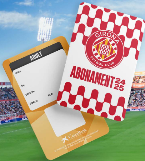
CON EL CARNET FÍSICO