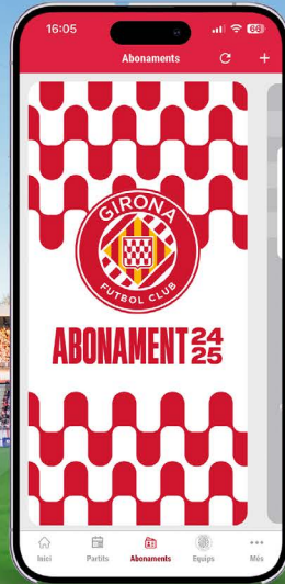
A TRAVÉS DE NUESTRA APP