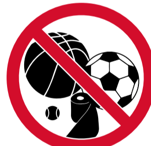
Objectes que puguin ser llançats