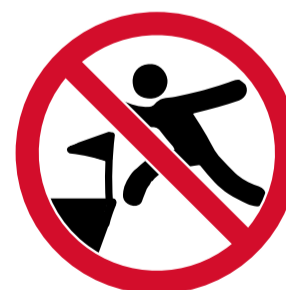
Envair el terreny de joc