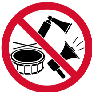
Instrumentes sense autorització, botzines i megàfons