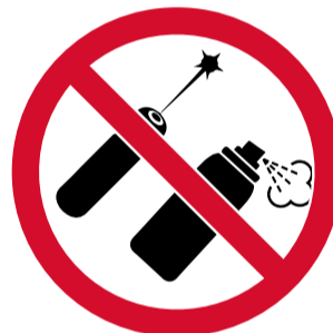
Puntadors làser i aerosols