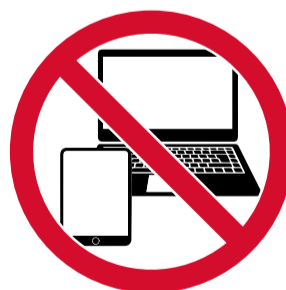
Ordinadors i tauletes