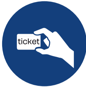
Mostrar el tiquet d'entrada quan se sol·liciti