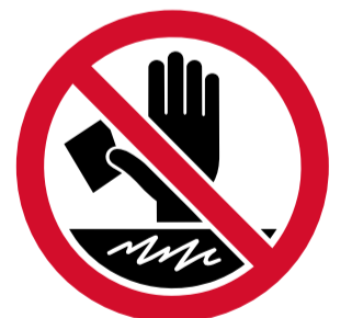
No enganxar, ratllar ni manipular les instal·lacions