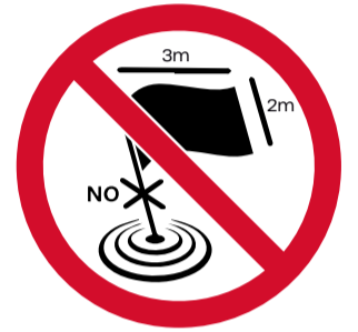
Pals i màstils de qualsevol tipus, banderes i pancartes de com a màxim 2x3 m (ofensives de qualsevol mida)