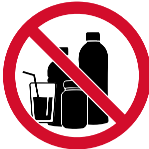
Envasos / recipients rígids i de capacitat superior a 500 ml (amb els taps retirats en qualsevol cas)