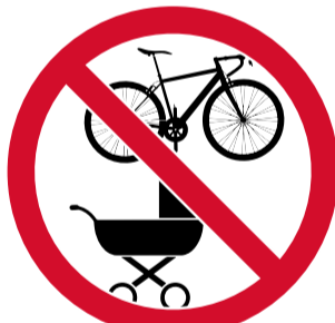
Cotxets de nadó, patinets, monopatinis i bicicletes