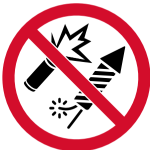
Bengales i focs artificials