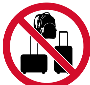
Maletas, equipaje de mano y mochilas. El estadio no dispone de servicio de consigna