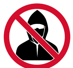
Usar máscaras, pasamontañas, capuchas o cualquier otro objeto que cubra parcial o totalmente la cara.