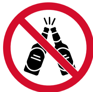
Bebidas alcohólicas o estar bajo sus efectos.