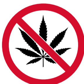
Drogas o estar bajo sus efectos