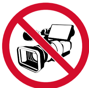
Grabar videos, imágenes y audio con equipos profesionales y/o acceder con ellos.