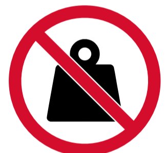
Objetos superiores a 500 g.