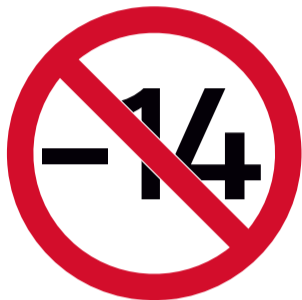
Acceso de menores de 14 años sin ir acompañados de un adulto.