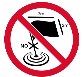
Palos y mástiles de cualquier tipo, banderas y pancartas de máximo 2x3 m, ofensivas de cualquier medida.