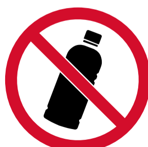
Todo objeto susceptible de ser lanzado.