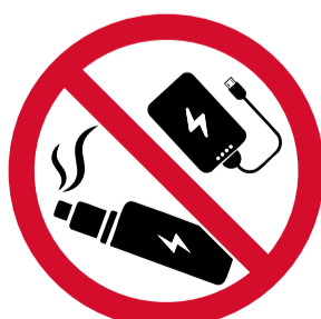
Baterías externas y cigarrillos electrónicos