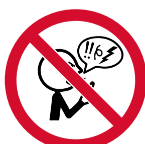
Expresiones que inciten a la violencia, la xenofobia, el racismo y la intolerancia.