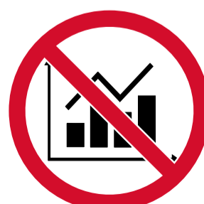
Realizar labores de estadística deportiva de cualquier tipo.