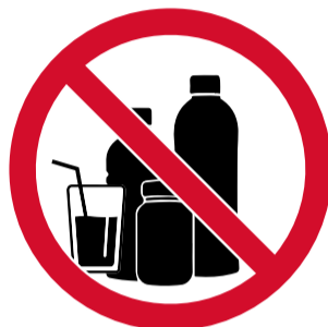
Envases / recipientes rígidos y de capacidad superior a 500 ml, en cualquier caso con los tapones retirados.