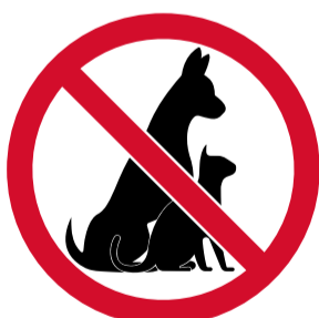
Mascotas, excepto perros guía.