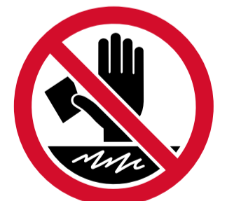
No pegar, rayar ni manipular las instalaciones.