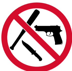
Armas y objetos contundentes