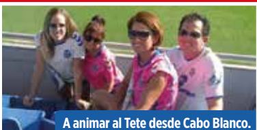
A animar al Tete desde Cabo Blanco.

¡Envíanos tu foto! a revistabotaheliodoro@gmail.com