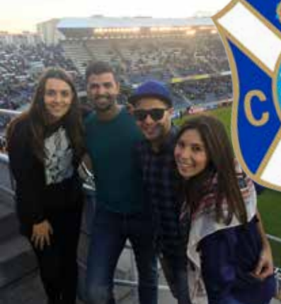
José Miguel & Cía.