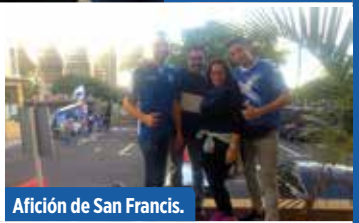
Afición de San Francis.