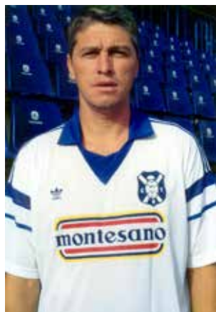
Tenerife que acababa de aterrizar en el fútbol profesional, plagado de jóvenes canteranos.

Ídolo en Murcia, donde logró dos ascensos a Primera División. Llegó a la Isla ya veterano, pero sumó 112 partidos y 22 goles en tres cursos. Le aportó estabilidad al juego, supo explotar sus condiciones en las acciones a balón parado y fue básico en la transición que llevó a la élite a un