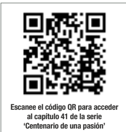
Escanee el código QR para acceder al capítulo 41 de la serie 'Centenario de una pasión'

Formado en el Arenas y el Toscal, jugó como emigrado en Venezuela, regresó a España, fichó por el Real Madrid, conoció un carrusel de cesiones (Recreativo, Hércules, Celta –con el que ascendió a la élite– y otra vez el Recre), sufrió una grave lesión y volvió a casa para recuperarse y para dar veteranía a un grupo de jovencísimos canteranos que devolvieron a la Isla al fútbol profesional.