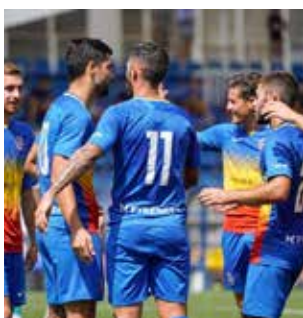
Jugadores del Andorra celebran un gol.